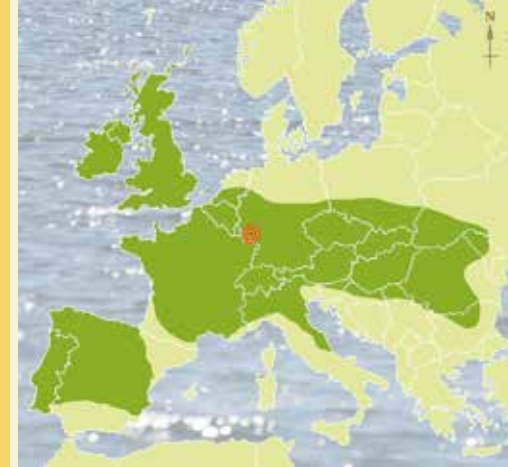
Verbreitung der keltischen Stämme um ca. 300 v. Chr.

Die 2500-jährige Kulturgeschichte des St. Wendeler Landes beginnt mit den Kelten, die uns mit dem mächtigen Ringwall von Otzenhausen und reichen Fürstengräbern herausragende Zeugnisse hinterließen. Im 4. und 3. Jahrhundert v. Chr. erweiterten sie ihren Siedlungsraum auf große Teile Europas. Bereits zu Beginn des 5. Jahrhunderts v. Chr. hatten sich die keltischen Kultur- und Machtzentren vom süddeutsch-österreichischen Raum in das Gebiet zwischen Mittelrhein, Mosel und Saar verlagert. Als Ursache werden die hiesigen Eisenvorkommen vermutet: Das besondere Wissen der Kelten um die Eisenverhüttung und ihre Schmiedekunst begründeten wahrscheinlich ihren Reichtum. Befestigte Höhensiedlungen entwickelten sich zu Machtzentren; ab dem 2. Jahrhundert v. Chr. entstanden stadtähnliche Ansiedlungen, sogenannte Oppida.