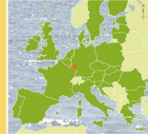
Die Europäische Union, Stand 2013

Mit der Entdeckung Amerikas entstand der Kolonialismus. Er bildete die Grundlage für die Machtentfaltung vieler europäischer Staaten und ihre Vorherrschaft in der Welt.