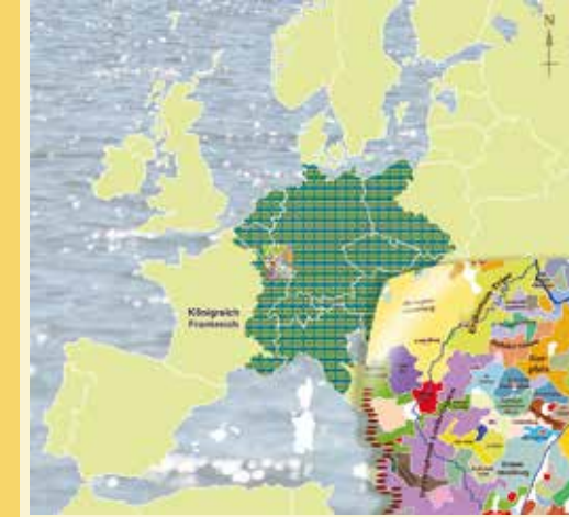
Ein Flickenteppich von über 300 Territorien um 1400 n. Chr.

Aus dem fränkischen Ostreich - dem späteren Deutschland - entwickelte sich das "Heilige Römische Reich" als ein loser Verbund souveräner Territorien. Unter der Führung eines Königs oder Kaisers entstanden verwirrend viele lokal regierte Gebiete, die sich im Laufe der Jahrhunderte - ebenso wie die Reichsgrenzen - beträchtlich veränderten. Allein im St. Wendeler Land gab es zehn Herrschaften. Kirchliche und weltliche Herrschaft waren eng miteinander verwoben, so dass der Glaube auch als Machtinstrument diente. Zwar gab es in dieser Epoche Kriege, Kreuzzüge und Seuchen, aber auch Zeiten relativen Friedens und Wohlstands. Die aufstrebende Baukunst der Gotik versinnbildlichte das religiöse Lebensgefühl der Menschen. Minnesänger ergänzten die religiöse Dichtung erstmals mit weltlichen Themen.