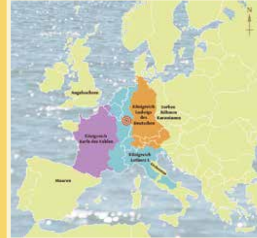
Dreiteilung des Fränkischen Reiches 843 n. Chr.

In erster Linie fränkische (= germanische) Stämme unterwarfen das römische Nordgallien und dehnten ihren Machtbereich durch fortwährende Kriege aus. So entstand das Fränkische Reich, eine für die weitere Entwicklung Europas bedeutende Großmacht in West- und Mitteleuropa. Chlodwig, ein König aus der Merowinger-Dynastie, eroberte weite Gebiete im Süden, übernahm von der gallo-römischen Bevölkerung den katholischen Glauben und stellte wichtige Weichen für die Zukunft. Der Karolinger Karl der Große rundete mit den Eroberungen im Norden den fränkischen Herrschaftsbe- reich ab. Mit seiner Krönung zum Kaiser in Rom war die Reichsbildung abgeschlossen.